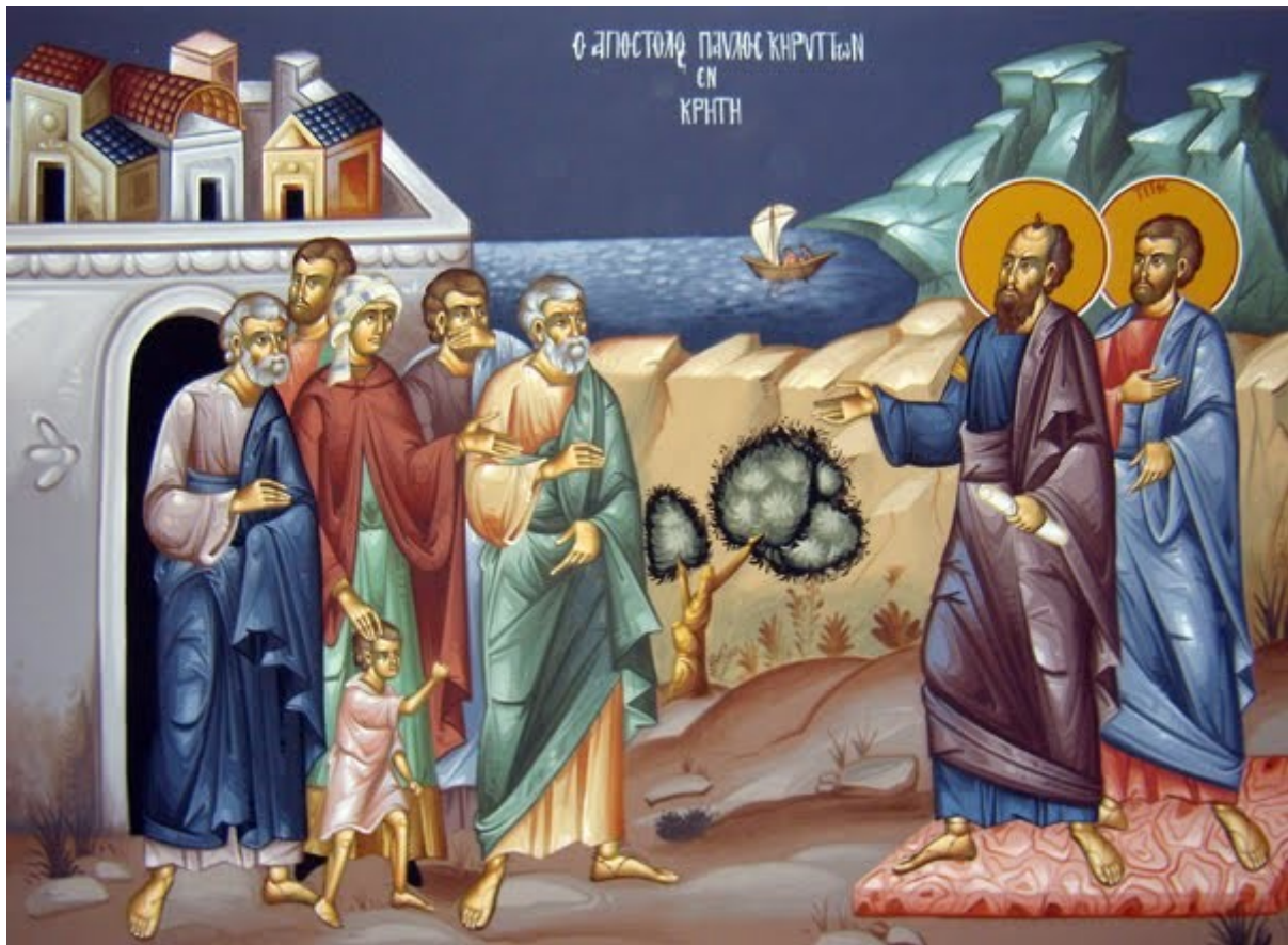
Paulus auf Kreta