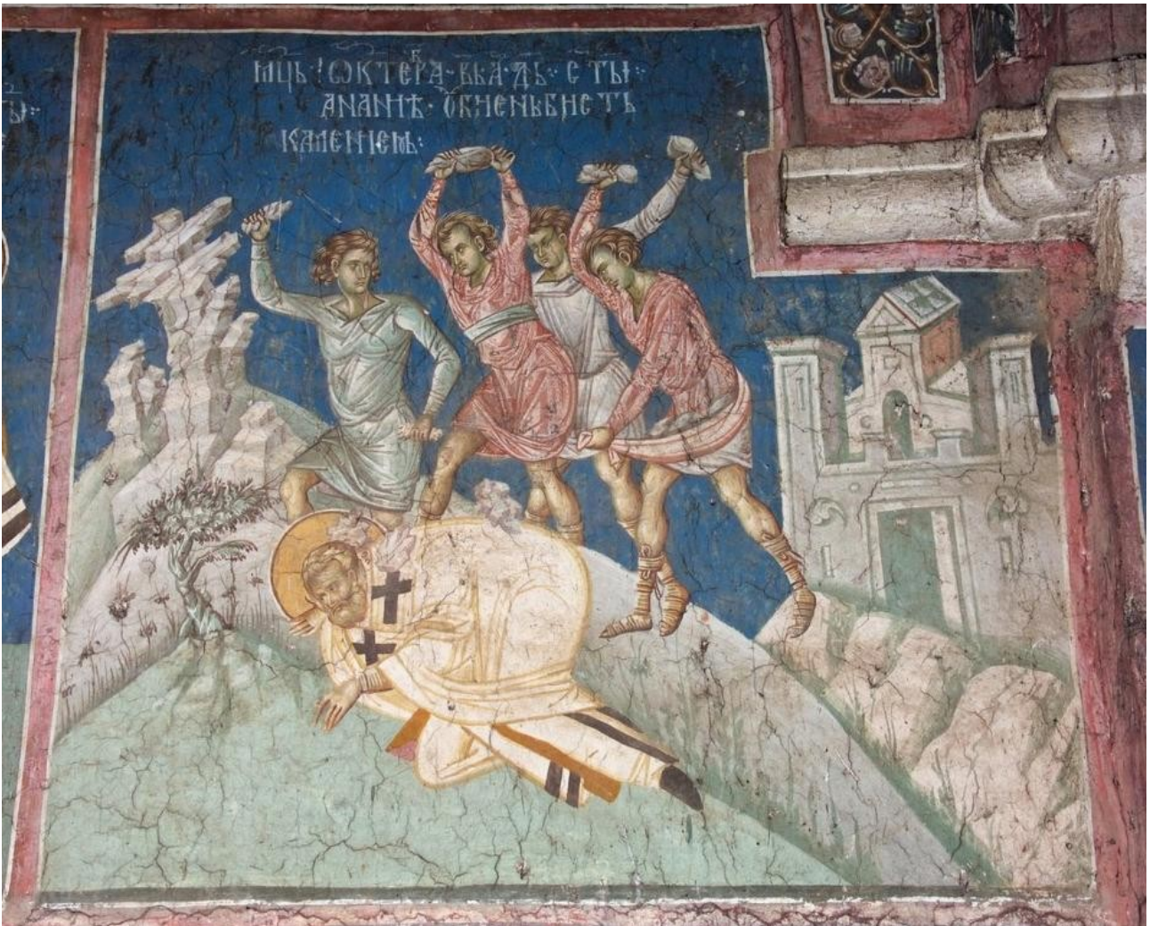
Die Steinigung des Apostels Ananias (Er hatte Paulus getauft)