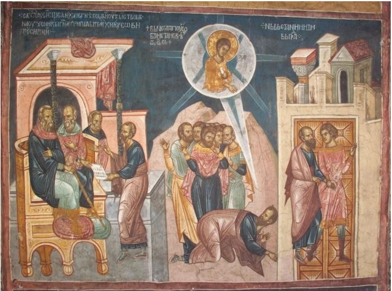
Die Umkehr des Saulus