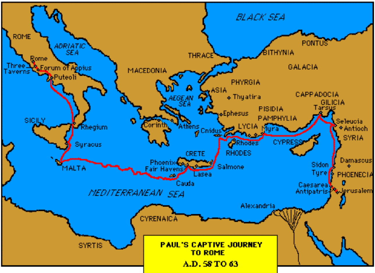
Die Gefangenereise nach Rom