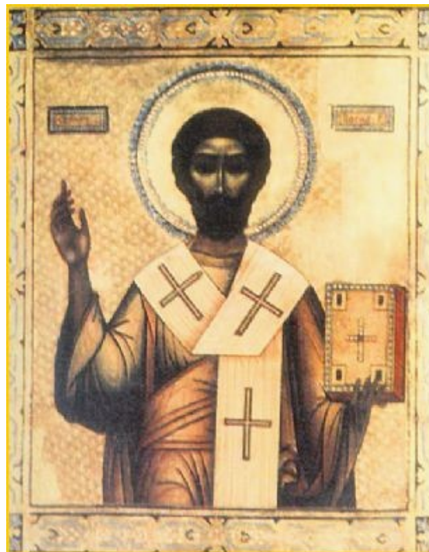
Der Hl. Apostel Barnabas, ein Mitarbeiter des Paulus