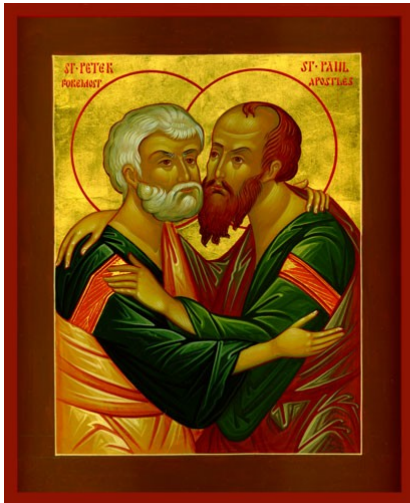
Die Hll. Apostel Petrus und Paulus