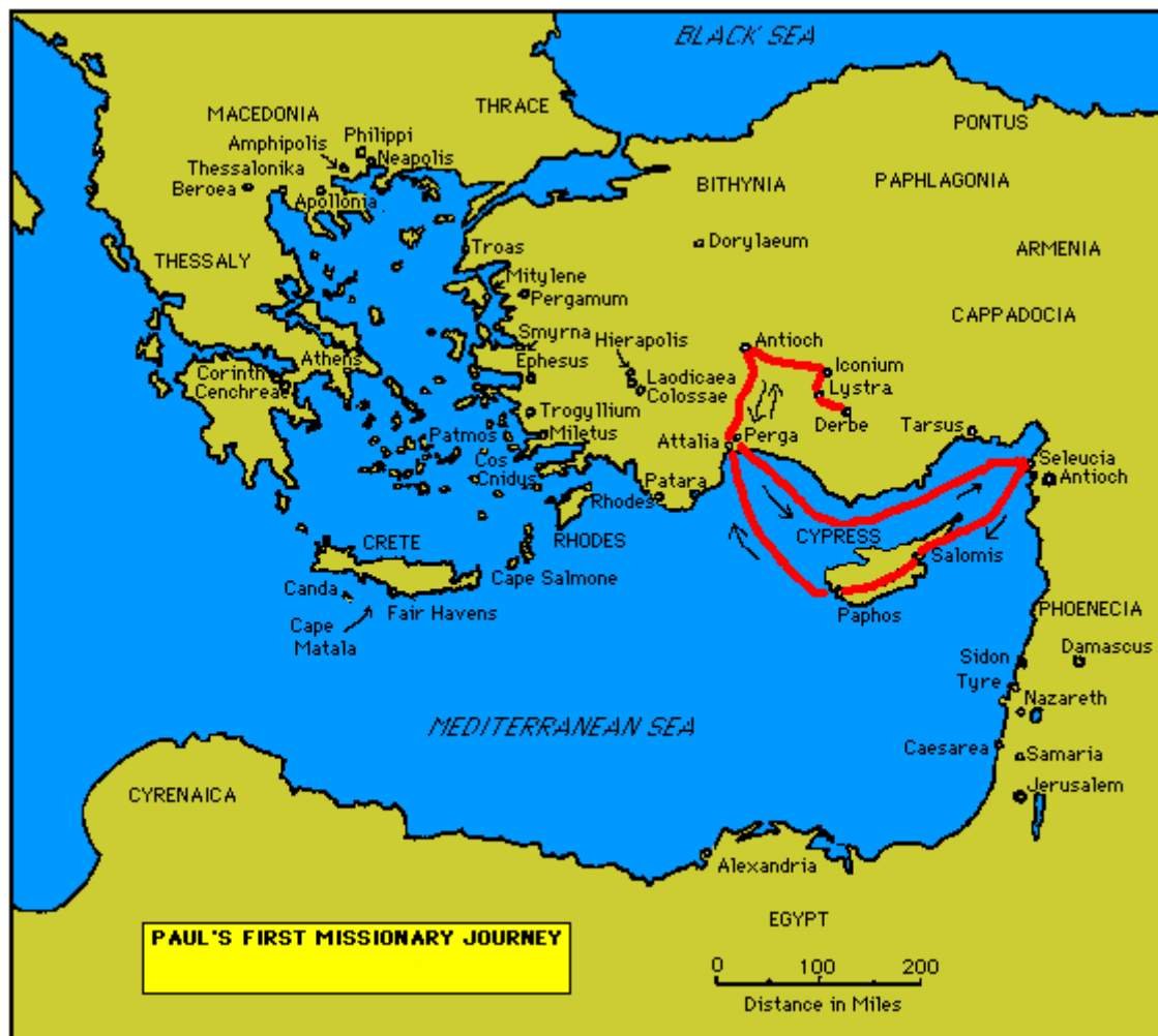
Erste Missionsreise des Paulus

Dieses Ungeheuer in Menschengestalt, Nero, brachte seine Mutter Agripina, seine Tante, seine Gemahlin Oktavia und viele andere Verwandte um; schließlich rief er eine allgemeine Christenverfolgung in Rom aus. Doch die göttliche Gerechtigkeit vergalt Nero sein Tun. Das Volk von Rom hasste ihn dermaßen, das er aus seiner Stadt floh und in den dichten Wäldern umherirrte. Die furchtbare Kälte und der schlimme Hunger verursachten seinen raschen Tod. So fraßen die wilden Tiere seinen Leichnam, während seine Seele dem Gericht Gottes übergeben wurde.